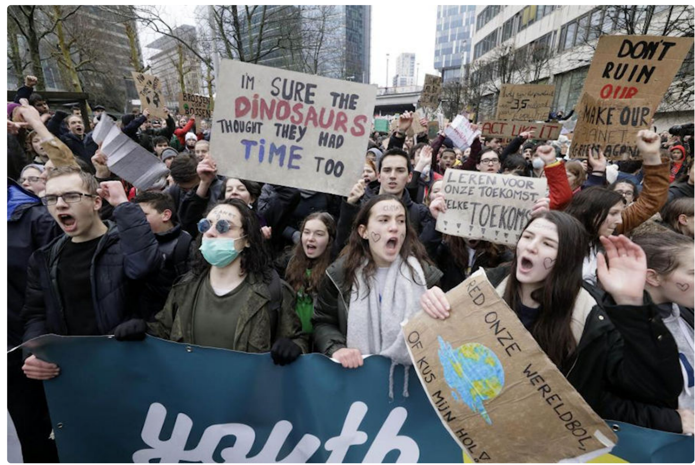
Des jeunes marchent « pour le climat », comme ici dans les rues de Bruxelles le 24 janvier 2019.

Excellente trouvaille, ce danger du CO 2 , qui permet de vendre des milliers d'éoliennes affreusement coûteuses mais rapportant gros à leurs constructeurs et à leurs promoteurs. Et tant pis si le résultat est une augmentation de la pollution comme en Allemagne !